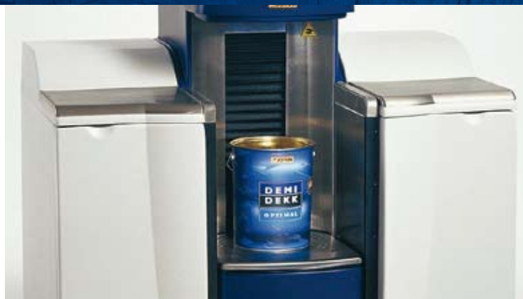
Für DEMIDEKK stehen eine Vielzahl von Farbtönen zur Auswahl

Mit DEMIDEKK Optimal Fenster- und Türenqualität steht Ihnen ein Produkt zur Verfügung, das dem neuesten Stand der Technik mit jahrzehntelanger Erfahrung vereint. So wurde die bewährte AMA-Technologie (Alkydharzmodifiziertes Acrylat) erstmals auf ein Produkt für Fenster und Türen angewendet. Die bekannten Vorteile, wie gute Penetration, hohe Glanz- und Farbtonstabilität sowie optimaler UV- und Wetterschutz, konnten so vereint werden ohne dabei wichtige Faktoren, wie hohe Blockfestigkeit, guter Verlauf und kurze Trockenzeiten außer Acht zu lassen. Kurz: Mit DEMIDEKK Optimal Fenster- und Türenqualität halten Sie ein absolutes Spitzenprodukt für den langfristigen Schutz Ihrer Fenster und Türen in den Händen.